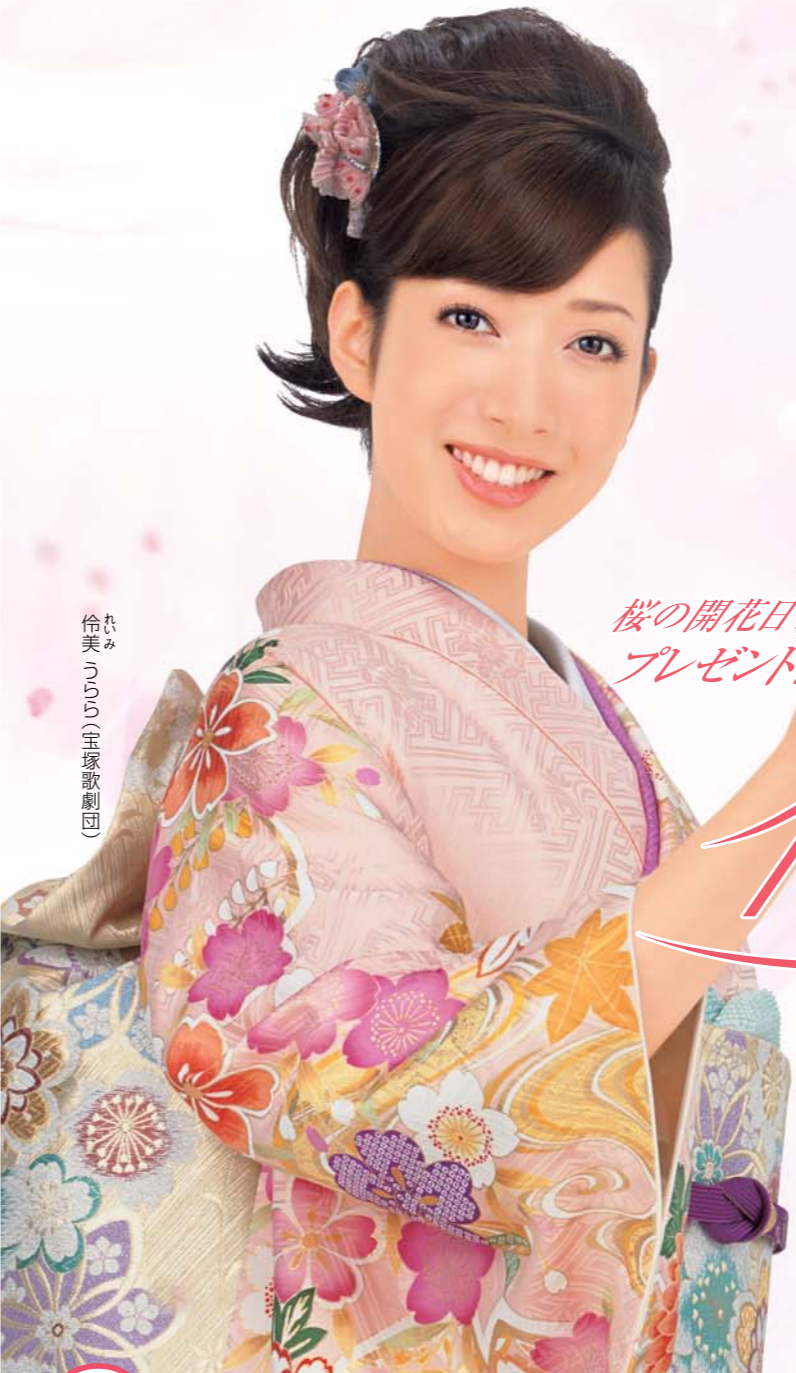
伶美(らみ)宝塚歌劇団