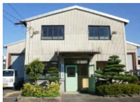
豊岡工場（日高町日置）