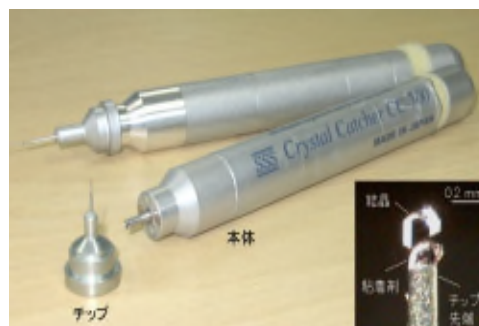
当社開発の粘着式結晶マウントツール