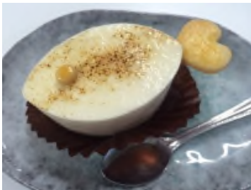
左： サ バ cavaフロマージュ (全国のSABARで提供予定)