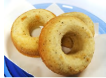
右： そ う ざ い SOZAI! さばドーナツ (物販商品として提供予定)