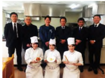
中央：関係者試食会の様子