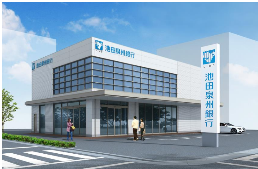
新店舗完成イメージ