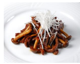
鹿肉の味噌炒め クレープ包み

※ 白鹿クラシックスと愛蓮苦楽園店では、鹿肉料理に合う、「白鹿オリジナルカクテル」も販売いたします