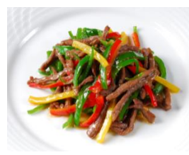
鹿肉とピーマンのスパイス炒め

店舗名：愛蓮 苦楽園店 住所：兵庫県西宮市菊谷町2番25号 電話：0798-73-0025 営業時間：平日 11:30～14:30(L.O.14:00) 17:00～21:00(L.O.20:30) 土日祝 11:30～21:00(L.O.20:30) 定休日：無休 URL: https://www.ikarisuper.com/author/airen_kurakuen/