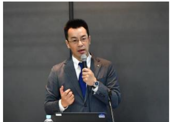
特別セミナーの様子③

（※）2019年10月16日（水）～18日（金）まで、インテックス大阪（大阪市住之江区南港北1-5-102） で開催された、関西最大級の“食”の見本市（主催：日本食糧新聞社）