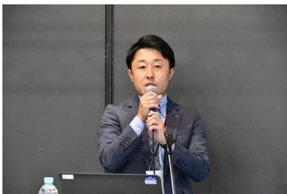
特別セミナーの様子②