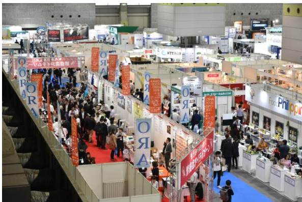
ファベックス関西 会場の様子

セミナー参加者さまにおいて、企業内での福利厚生制度の一環として、「前給」サービス のご認識を高めていただく機会となりました。