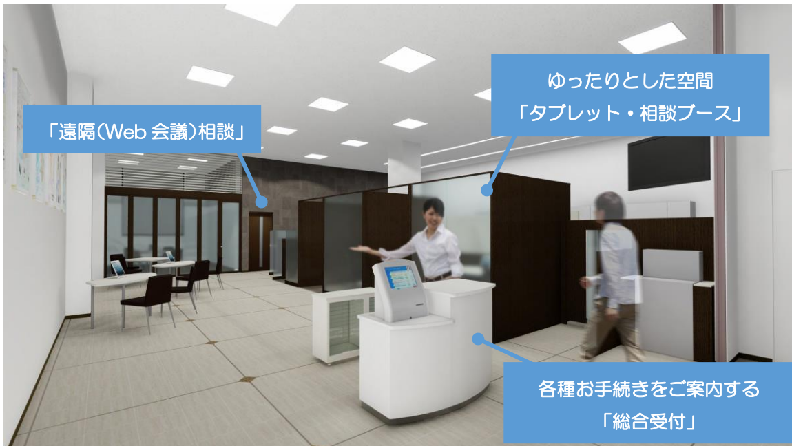
「タブレット・相談ブース」