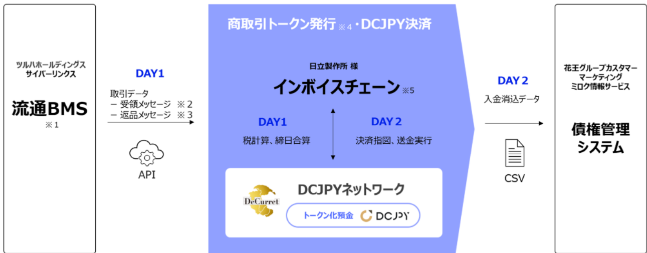
【図：実証実験のスキーム図】