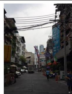
日本人が多く住むエリア

れています。そのため、日常生活において日本食に苦労することはありません。また、日本食材を取り扱うスーパーがあり、ローカル資本のスーパーにおいても日本食材を購入することが出来ます。最近では新たな流通チャンネルとしてエリアを限定した宅配サービスも登場しており、お米や冷凍食品、飲料などを自宅まで届けてくれますので、高価格（日本製品は日本の約2倍～4倍）ではあるものの、日本食で生活する環境が整っています。