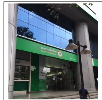
日本語窓口のあるスクンウィット 33 支店