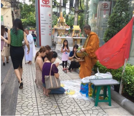
オフィス前の朝の光景（女性は僧侶に触れてはいけません）

また、合掌についても日本人が行うような合掌とは異なり、タイ人ならではの合掌の形があります。一般に、日本においては合掌と言えば両手に空間を作らないよう手を合わせるかと思いますが、タイでは両手にわずかに空間を作り、花のつぼみのような形を作ります。そして、その空間に「思いやり」や「敬う心」などその人に対する気持ちをこめるようです。