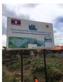
パクセジャパン 中小企業専用経済特区