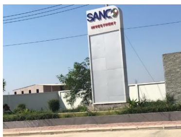
サンコーポイペト SEZ