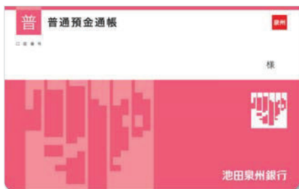
普通預金通帳 （ 泉州 マークの記載あり）