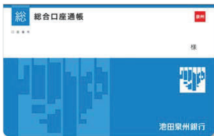
総合口座通帳 （ 泉州 マークの記載あり）